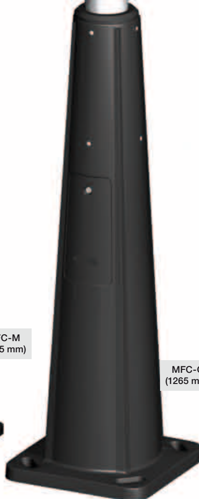
MFC-G (1265 mm)