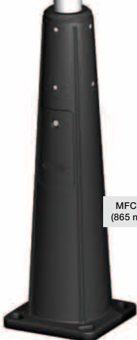
MFC-P (865 mm)