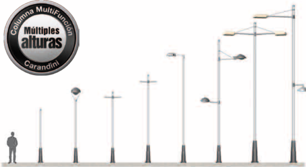
MFC-300 (3 m) MFC-350 (3,5 m) MFC-401 (4 m) MFC-501 (5 m) MFC-600 (6 m) MFC-702 (7 m) MFC-801 (8 m) MFC-902 (9 m)