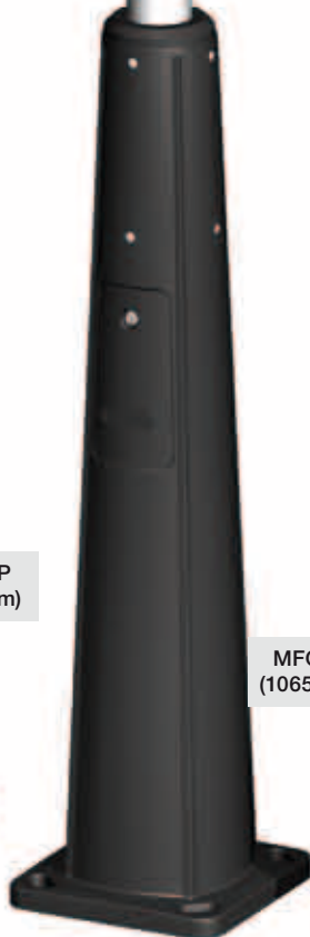
MFC-M (1065 mm)