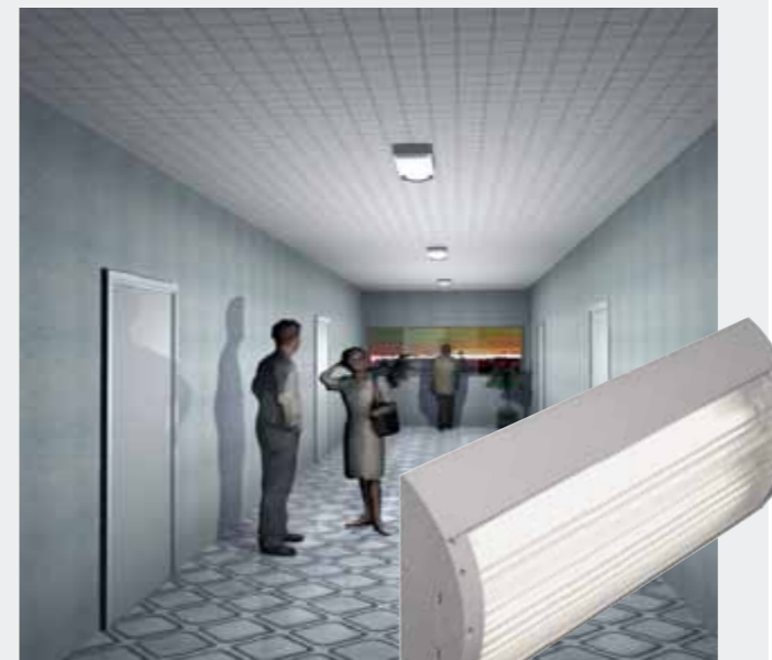
Montaje "MP" Superficie plana distribución simétrica