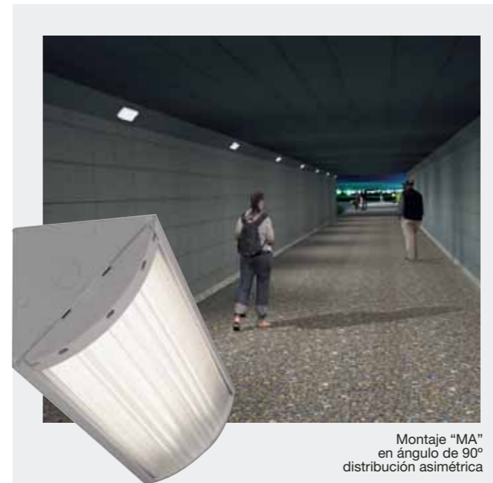
Montaje "MA" en ángulo de 90° distribución asimétrica